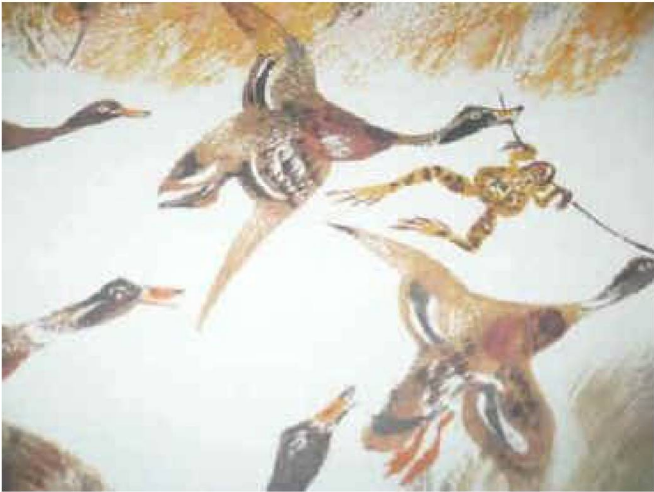
4. Лягушка из сказки В. Гаршина “Лягушка-путешественница”, отправившись в путешествие, воспользовалась своим правом на ...